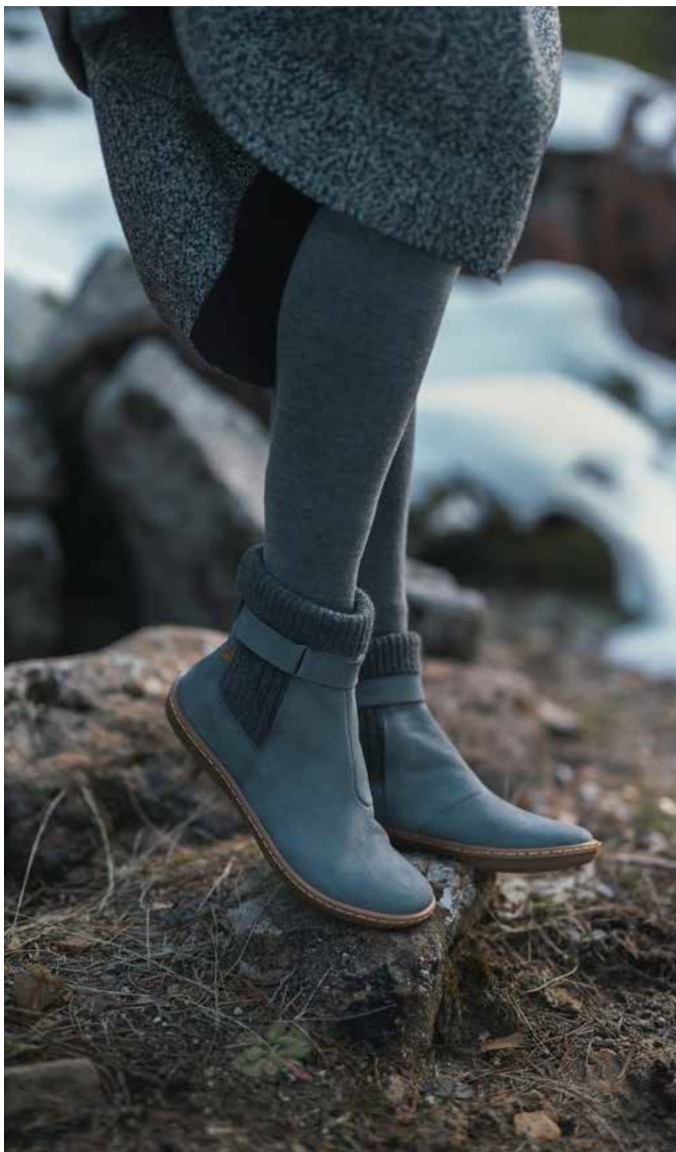
CORAL WOMEN COLLECTION AW22