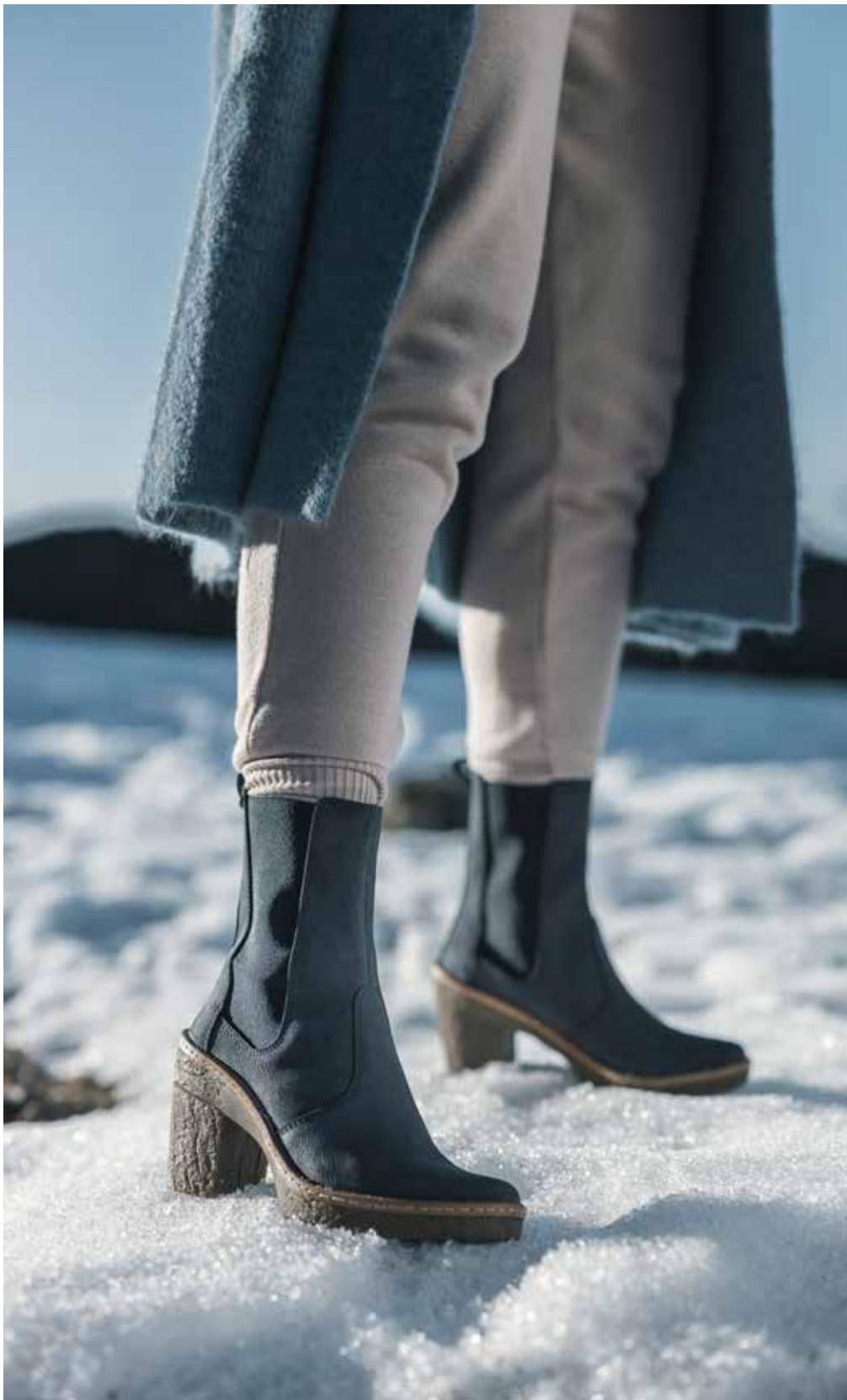
HAYA WOMEN COLLECTION AW22