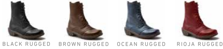
BLACK RUGGED BROWN RUGGED OCEAN RUGGED RIOJA RUGGED