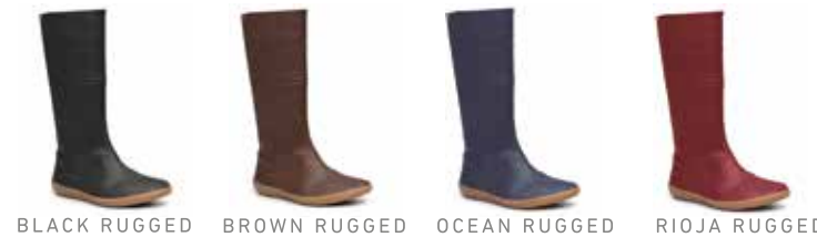
BLACK RUGGED BROWN RUGGED OCEAN RUGGED RIOJA RUGGED