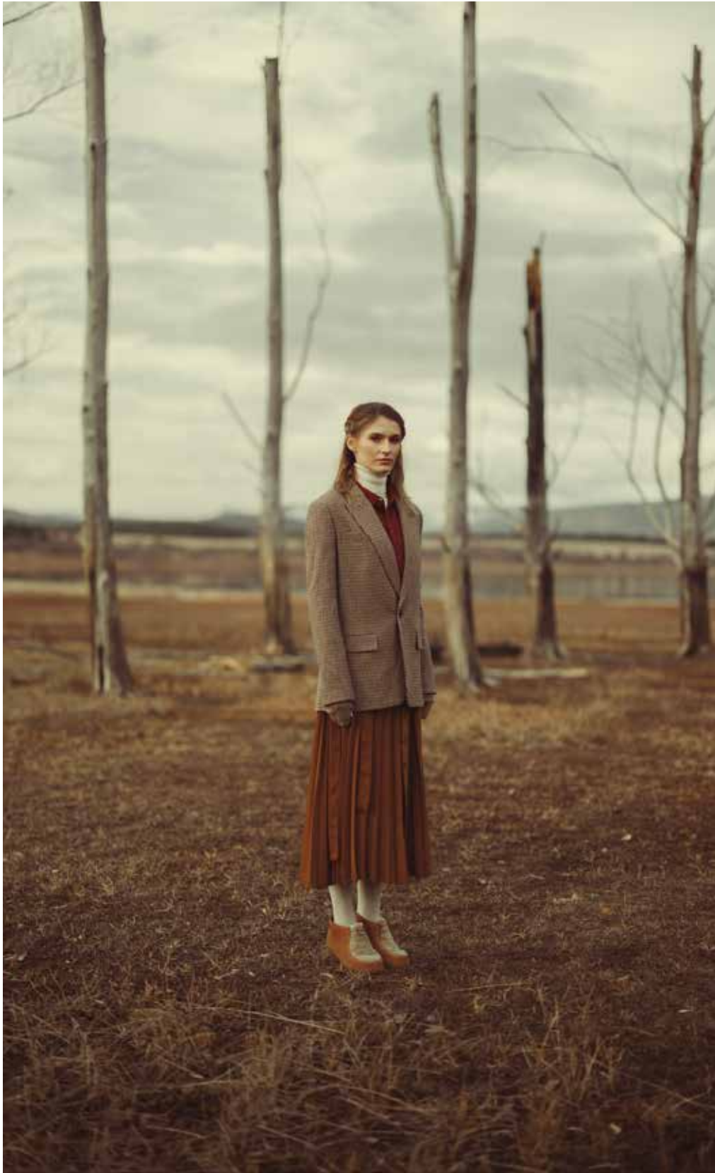
REDES UNISEX COLLECTION AW22