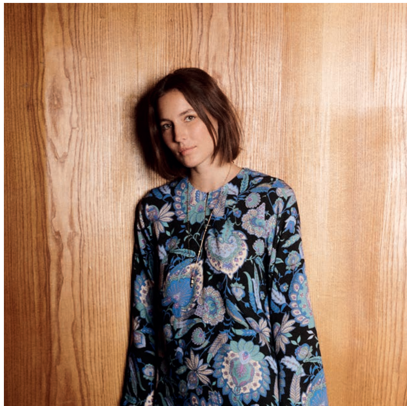
ROBE/DRESS : FI-RO-ZRATT-L_248 COLLIER/NECKLACE : FI-AB-ZEGER_1250 CHAUSSURES/SHOES : FF-AS-SACARI_810