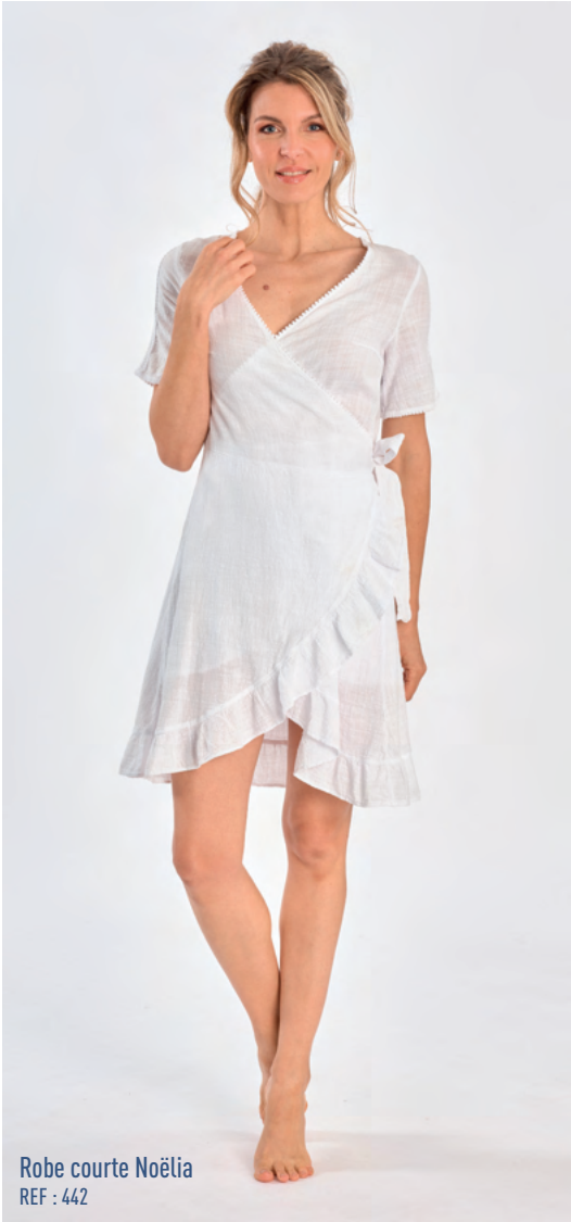
Robe courte Noëlia REF : 442