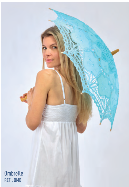
Ombrelle REF : OMB