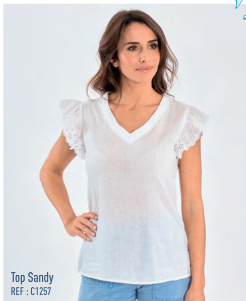
Top Sandy REF : C1257