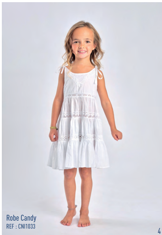
Robe Candy REF : CN1033