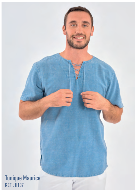
Tunique Maurice REF : H107