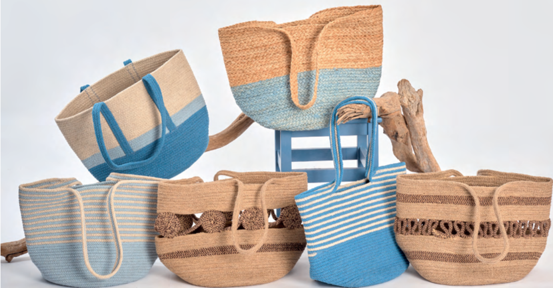
Lot de 6 paniers REF : PAN11