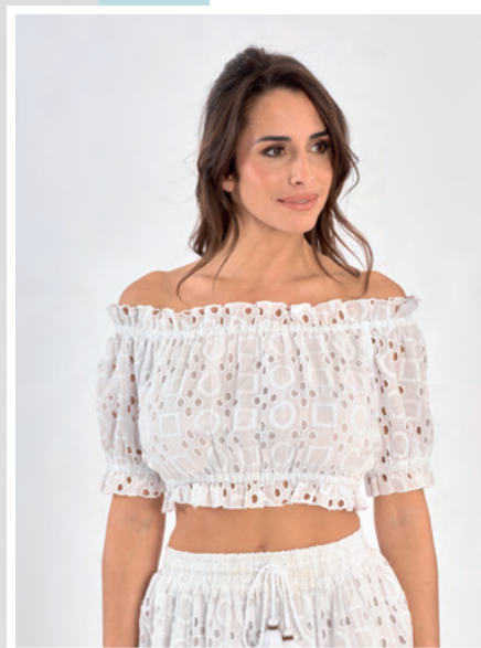
Crop top Sana REF : 07002