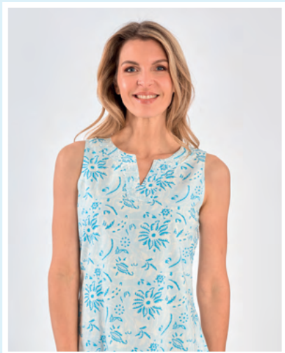
Robe Antigua REF : 03001