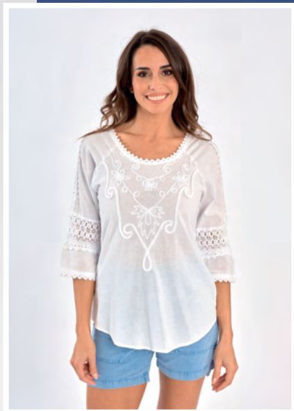
Tunique Vilma REF : 670