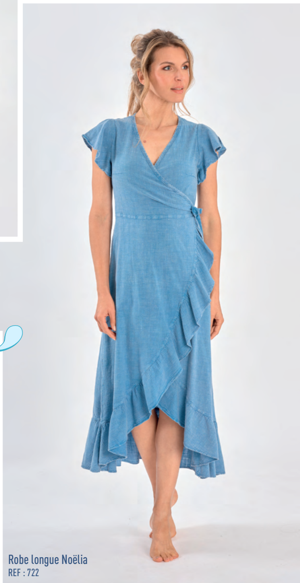
Robe longue Noélia REF : 722