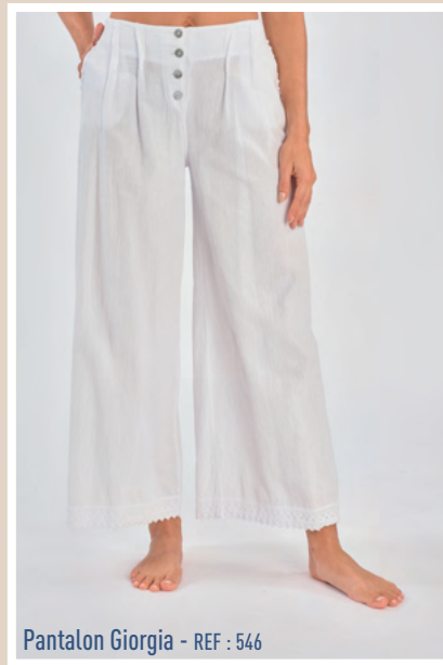
Pantalon Giorgia - REF : 546