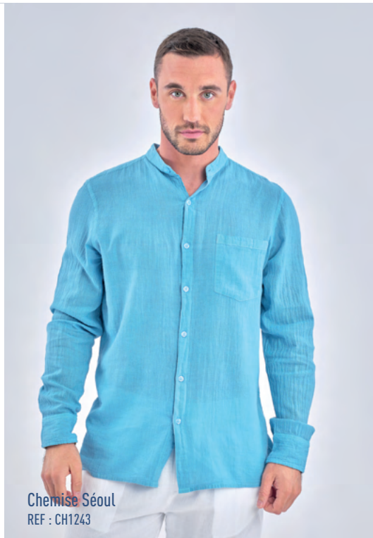
Chemise Séoul REF : CH1243