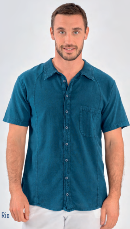
Chemise Rio REF : H127