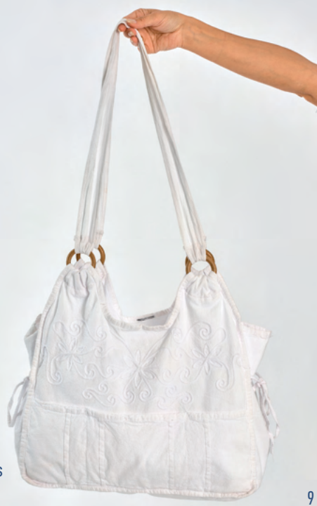
Sac Inès REF : 406