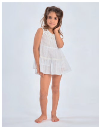
Robe Maya REF : E0328