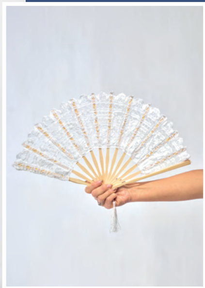
Eventail REF : EVE