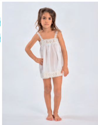
Robe Poupée REF : E0327