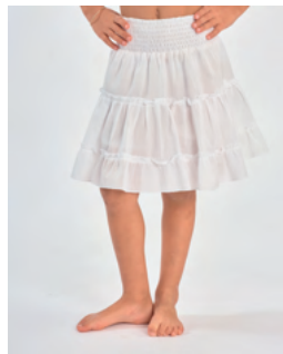
Jupe Vanille REF : E0220