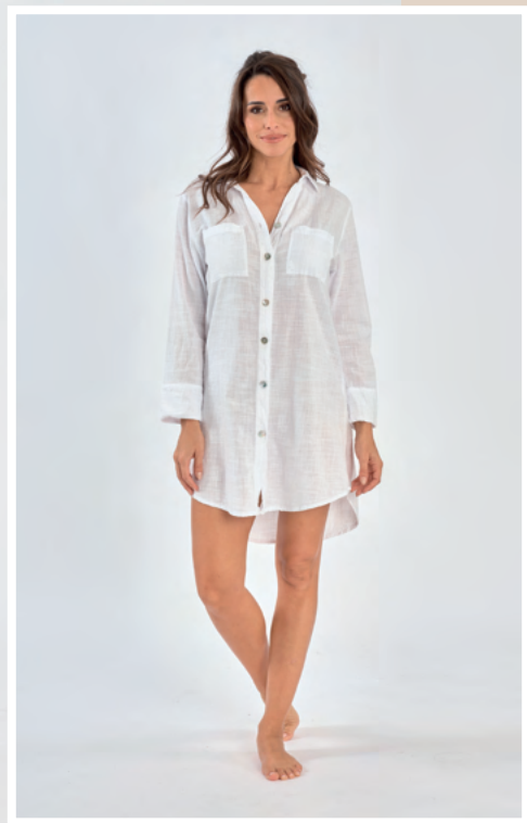
Chemise longue Solange REF : 667