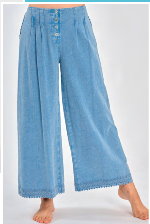
Pantalon Georgia REF : 546