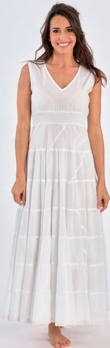
Robe longue Elona REF : 04001