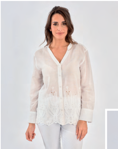
Chemisier Aurore REF : 08300