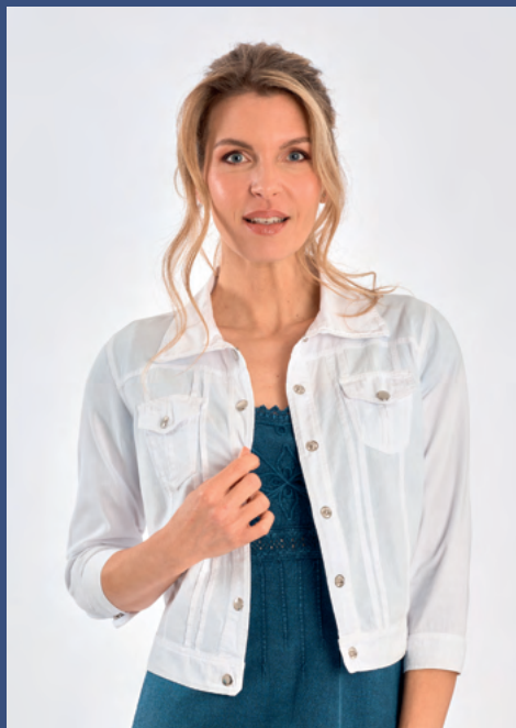
Veste Katrina REF : 665