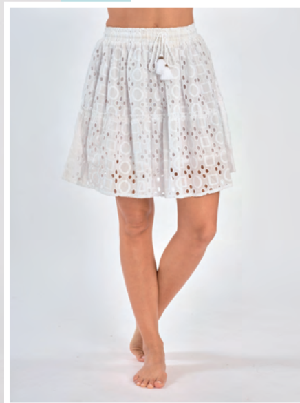
Jupe courte Sana REF : 02002