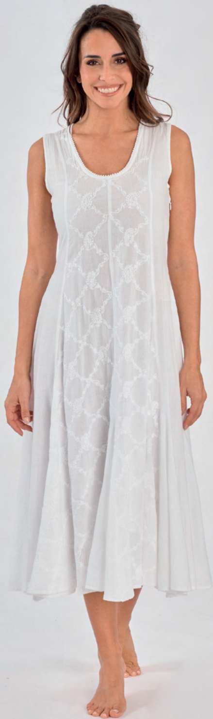
Robe Pure REF : C1723