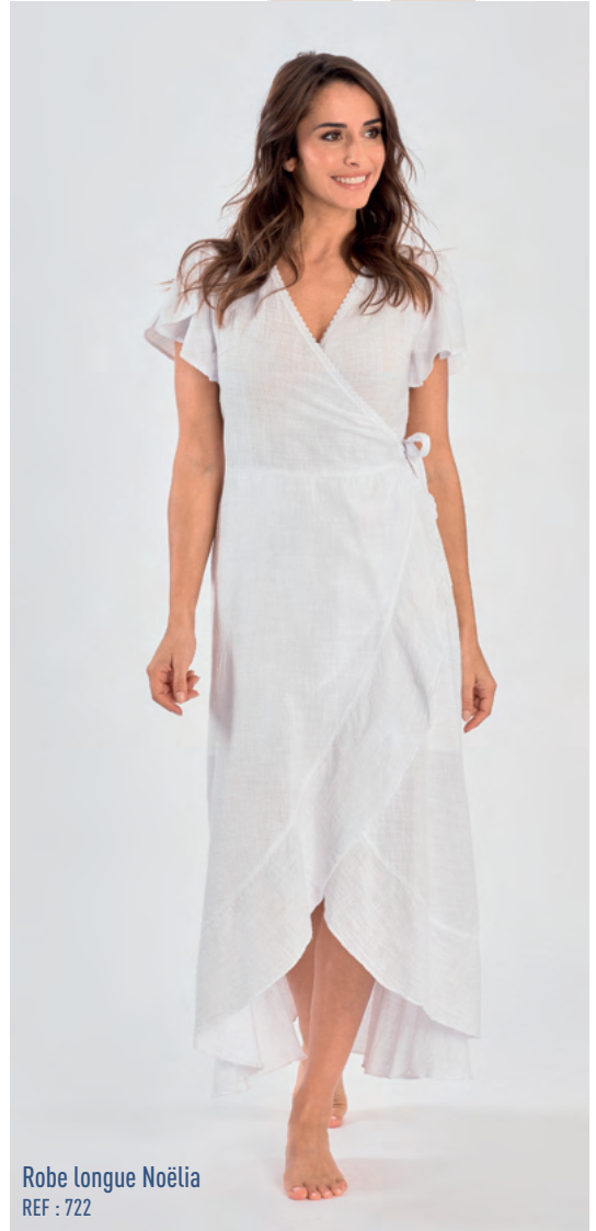
Robe longue Noëlia REF : 722