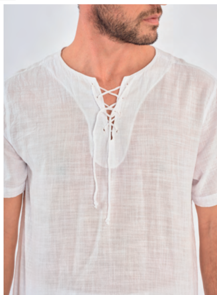
Tunique Maurice REF : H107