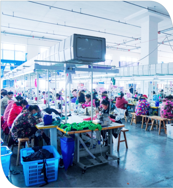
车缝车间 Sewing workshop 縫製ライン区