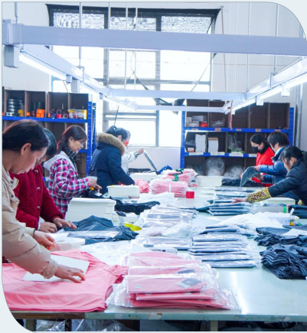
包装区 Packaging area 梱包区