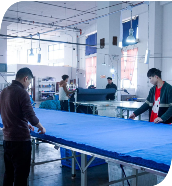
裁床区 Cutting Area せん断区域