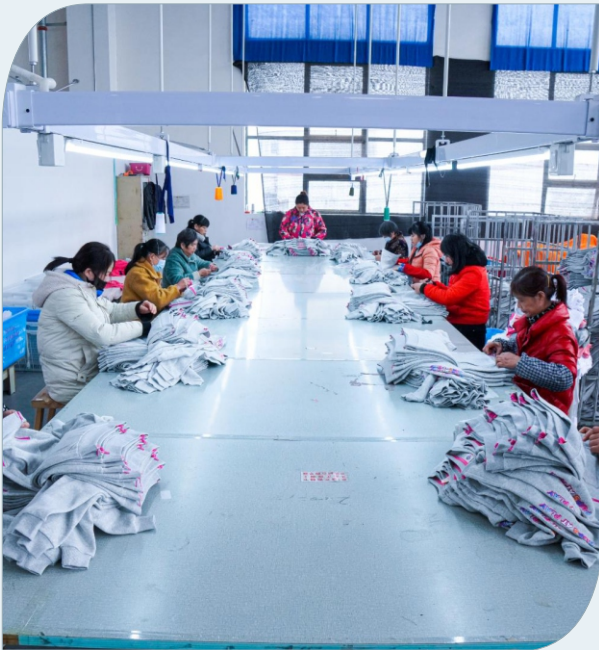
质检区 Quality inspection area 品質検査区