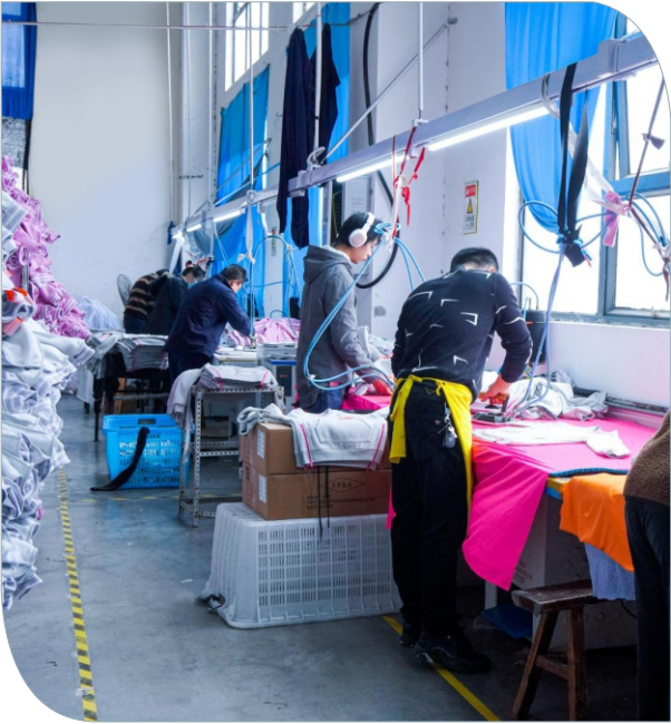
整烫区 Ironing area アイロン区