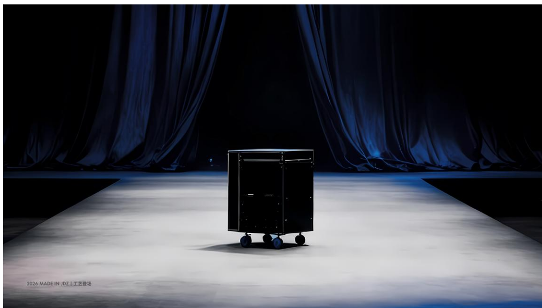
[Made in JDZ 概念图]

特别策划「Made in JDZ」将以「工艺登场」(Craft on the Stage) 为主题。继去年以「工艺发声」让大众听见手工艺的时代回响，今年展区将探索「工艺跨界」，以更开放的当代视角呈现手工艺的多元可能。本届展区以“登场”为核心概念，强调工艺走出“展厅”，从传统语境进入时尚与生活的广阔舞台。视觉设计以“聚光灯”为灵感，象征工艺正在获得前所未有的关注，呼应其在当下年轻文化中的复兴与焕新。展陈特别采用“航空箱”结构，展开即为展示台，收合即为“移动装置”，赋予工艺展示以更多灵活性与现代感。