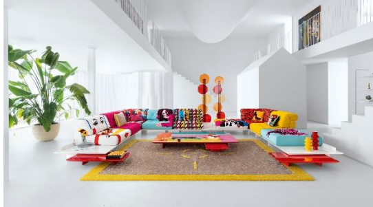
[Roche Bobois 罗奇堡]