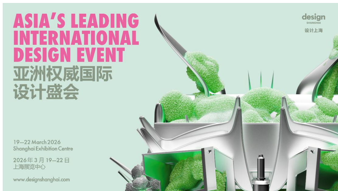
[“设计上海” 2026 全新视觉]

上海展览中心正是“设计上海”的首发之地, 以其绝佳的地理位置和充满艺术设计感的建筑风格备受设计品牌和大众的喜爱。2014 年, “设计上海”在这里横空出世, 开启了中国设计与全球设计的对话。阔别六年, “设计上海” 2026 将回归展览中心, 开启聚焦品质升级与体验升华的深度变革, 打造一场更具美学设计感、更国际化、体验更丰富的亚洲权威设计盛会, 载誉归来。