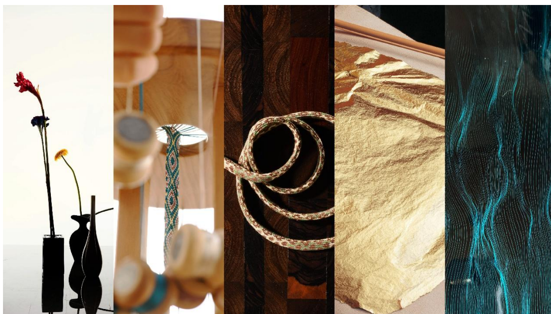
[Beyond Craft 工艺亮点]

「Beyond Craft」由“设计上海”于2024年发起，聚焦传统工艺的当代价值，面向建筑和室内装饰专业人士以及眼光独到的消费者，搭建深度交流与跨界创新的桥梁。至2026年，该展区将汇聚来自十余个品牌的多元创作，包括首饰、器物、家具、精密配件与光学装置等现代品类，涵盖西阵织、金箔、漆艺、和纸、编绳、陶瓷、玻璃雕刻、金属镶嵌等手工传统技艺，呈现从材料选择、结构构思到表面处理等创作环节，藉由匠人与艺术家的双手，生动诠释传统工艺在当代语境下的延续与新生。本届展览特邀由范建军与邱凡芝创立的范邱漆研所，带来融合传统大漆工艺与当代美学的特别体验，以古法为根，以现代生活为镜，观众将在漆器的细腻表达中，探寻工艺与情感的连接。