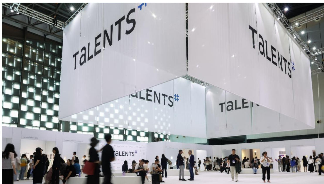
[TALENTS 2025 展区图]

特别策划「Made in JDZ」将以「工艺登场」(Craft on the Stage) 为主题。继去年以「工艺发声」让大众听见手工艺的时代回响，今年展区将探索「工艺跨界」，以更开放的当代视角呈现手工艺的多元可能。本届展区以“登场”为核心概念，强调工艺走出“展厅”，从传统语境进入时尚与生活的广阔舞台。视觉设计以“聚光灯”为灵感，象征工艺正在获得前所未有的关注，呼应其在当下年轻文化中的复兴与焕新。展陈特别采用“航空箱”结构，展开即为展示台，收合即为“移动装置”，赋予工艺展示以更多灵活性与现代感。