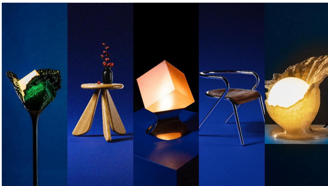
[Collectible Design & Art 品牌亮点]

「Beyond Craft」由“设计上海”于2024年发起，聚焦传统工艺的当代价值，面向建筑和室内装饰专业人士以及眼光独到的消费者，搭建深度交流与跨界创新的桥梁。至2026年，该展区将汇聚来自十余个品牌的多元创作，包括首饰、器物、家具、精密配件与光学装置等现代品类，涵盖西阵织、金箔、漆艺、和纸、编绳、陶瓷、玻璃雕刻、金属镶嵌等手工传统技艺，呈现从材料选择、结构构思到表面处理等创作环节，藉由匠人与艺术家的双手，生动诠释传统工艺在当代语境下的延续与新生。本届展览特邀由范建军与邱凡芝创立的范邱漆研所，带来融合传统大漆工艺与当代美学的特别体验，以古法为根，以现代生活为镜，观众将在漆器的细腻表达中，探寻工艺与情感的连接。