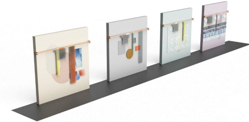
[Materials First 部分材料效果图]

念，构筑一个邀请观众亲手触碰、层层探索的互动空间。该展区将突破传统静态展陈模式而转向动态互动，以低技术门槛、高感知影响力的方式，带领观众探索 CMF 设计的创新潜力。在精心策划的“数字斑驳”、“色彩畸变”与“图案重构”三大互动板块中，观众可亲手将光栅薄膜、彩色滤光片等互动材料，自由叠加于不同质感的基础材料之上，在感知视觉与触感的即时变化中，亲身探索材料演变与再造的无限可能。