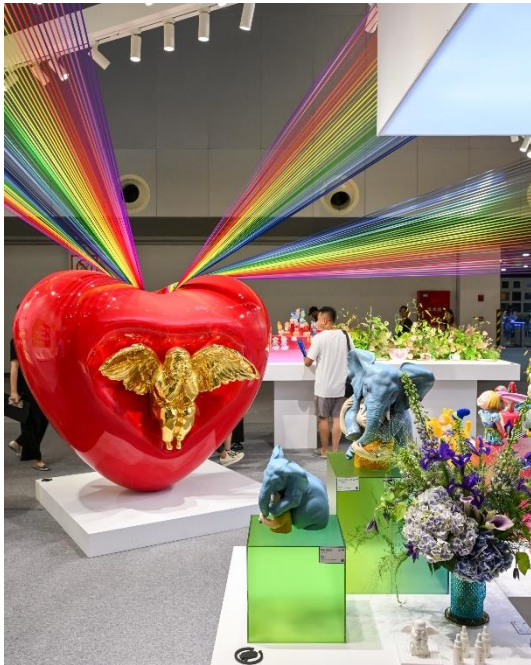
XIQI Art 稀奇艺术