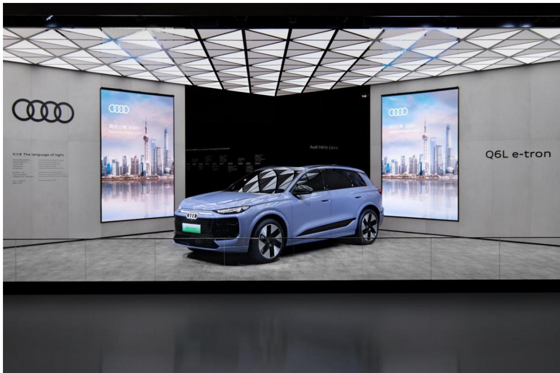
奥迪 Q6L e-tron

奥迪再次作为独家冠名合作伙伴亮相“设计上海”，带来了“光之语”互动性艺术装置，生动诉说以开创性的灯光设计与技术塑造未来高端出行的愿景。作为奥迪面向智能电动出行时代专为中国市场精心打造的最新杰作，奥迪 Q6L e-tron 也在展会惊艳亮相，彰显四环品牌深厚的设计底蕴和持续书写的进取新篇。