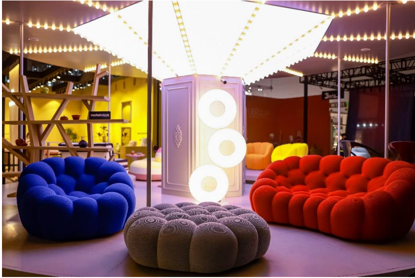
Roche Bobois 罗奇堡