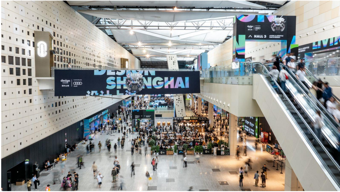
亚洲权威设计盛会“设计上海”现场

2024年6月19-22日，第十一届“设计上海”于上海世博展览馆成功举办，惊艳呈现了来自40多个国家的600余个品牌的千余件设计新品；350余位嘉宾汇聚5大论坛区域，带来百余场前沿的思维碰撞，捕捉和探寻设计的本质价值；8大特别策划装置和精彩纷呈的设计活动更为现场观众带来丰富的观展体验。为期4日的展会吸引了共计81,397位专业观众及设计爱好者到场，共同探讨行业前瞻趋势，以开阔的视角迈入设计新纪元。