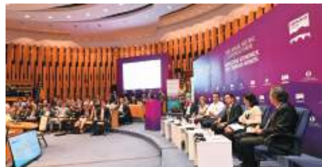
2019 歐銀年會大會現場。

歐洲復興開發銀行（European Bank for Reconstruction and Development, EBRD，簡稱歐銀）是一國際開發組織，範圍涵括中亞、中東歐、地中海沿岸及北非等 38 個開發中國家區域。由貿協辦理之「台灣歐銀業務發展辦事處」將協助您拓展歐銀區域之商機！