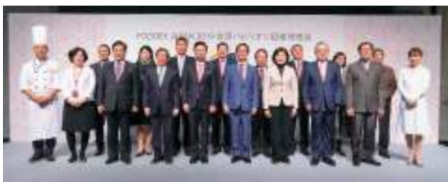
2019 年東京國際食品展——臺灣館記者會貴賓合影。

不論是蘭花、農產、水產、加工食品，還是時下最流行的珍珠奶茶，貿協都樂意協助業者打入世界盃。進入全球市場。貿協提供臺灣農漁產食品廠商多元國際拓展市場平台，歡迎善加利用，攜手共同開拓海外市場商機。