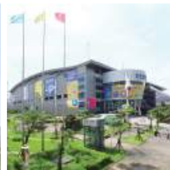
台北南港展覽館 1 館