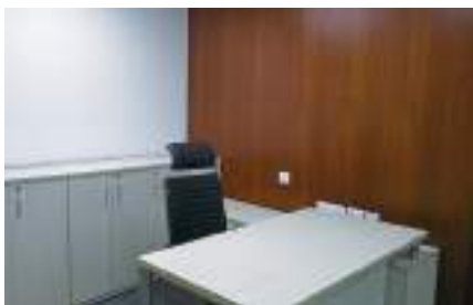
印度新德里辦事處—— 新德里商務中心提供辦公 室出租服務。

貿協海外商務中心提供優質、優惠的辦公空間，亦提供多國會議室免費借用，讓您在海外，輕鬆享有安心、安全、有保障的辦公環境；此外，貿協在全球的駐外單位還可提供當地經貿諮詢，讓您充分掌握當地商情。海外商務中心多元的地區選擇，是您海外拓銷的一大助力！