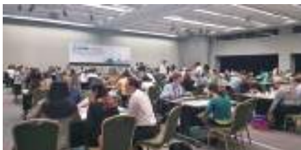
2019 年資通訊政府採購洽談會。

有興趣搶攻全球 1.7 兆美元的政府採購商機嗎？那您一定要瞭解貿協「爭取全球政府採購商機專案」(GP) 計畫。這個計畫提供業者從前期標案資訊的掌握，到開標結果的過程中，您所需要的一切協助，從廠商最常碰到的「能力」、「資訊」、「人脈」、「行銷」等四大問題，提供最好的解方，快加入「全球政府採購商機網」會員，獲得最新的相關資訊。