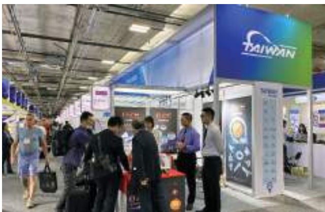
貿協辦理 2019 年「美國汽配展」帶領業者開發美國市場商機。

我國汽配產業在國際汽車售後維修服務市場占有相當重要的地位，其中美國市場占我出口比重高達近5成，為協助業者全球布局，規劃一系列拓銷活動，歡迎各位業者使用貿協專業服務，即時掌握市場商機，一同進軍國際市場。