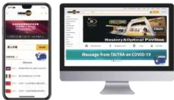
台灣經貿網響應式網頁設計，並提供聊天機器人及時對答服務。

貿協電商服務以台灣經貿網 (Taiwantrade.com) 為核心，透過各項電商服務，整合資訊流、金流、物流，創建電商生態圈，與 Facebook 及 Google 數位學程團隊聯手培訓電商營運人才，協助中小企業運用跨境電商平台，拓銷海外市場，也打造線上虛擬展館，讓買主不受時空限制與廠商互動，是協助企業轉型數位貿易的最佳資源。想抓緊這股數位經濟浪潮嗎？歡迎立即加入台灣經貿網，一起努力讓世界看見臺灣！