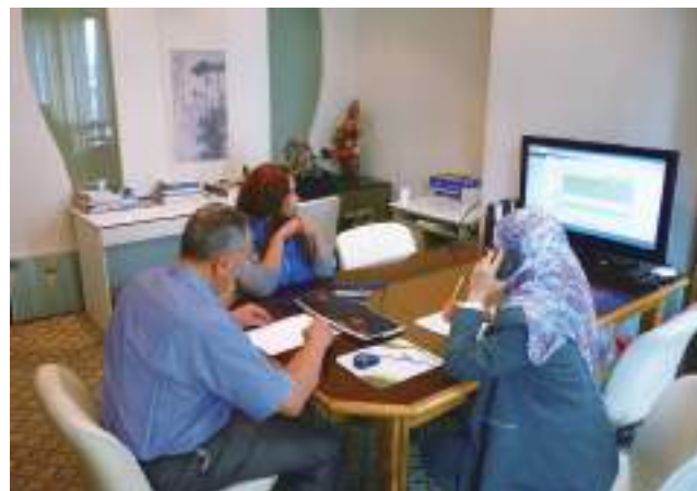
埃及開羅台灣貿易中心。

您可以透過貿協在全球 63 個駐外據點，快速地了解當地市場第一手商情及產業資訊，同時協助您拓展當地商機，提供客製化服務。茫茫海外市場不知從何開始嗎？讓我們協助您一起發展新市場吧！