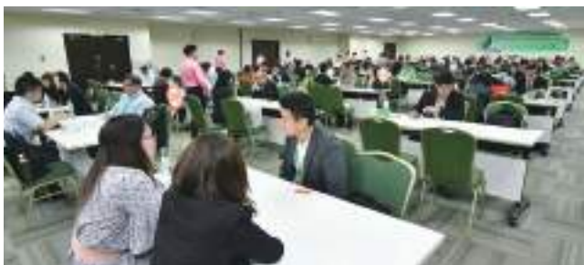
2019 年臺印度貿易論壇場面盛大、貴賓雲集。

透過辦理商機媒合會活動，積極促成國外買主來臺採購。以降低廠商遠赴海外拓銷成本，協助我中小企業爭取商機，達到提高出口之目的，同時促進產業發展及升級。相關洽談會資訊將不定期刊登於活動匯，歡迎廠商報名參加。