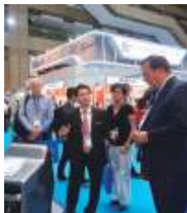
2019 年台灣國際醫療暨健康照護展，EEN 醫療產業群組率團來臺時安排專人展覽導覽，讓臺歐雙方直接面對面交流。