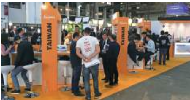
MWC 4YFN 新創大會臺灣館人潮踴躍。

臺灣以豐富的資通訊產業、研發製造能力與人才，帶動蓬勃發展的創新能量。貿協將協助五年內進入成長期、已開發出產品原型（Prototype），且其產品／技術／服務可接受市場測試的臺灣新創團隊，開拓海外市场或尋找海外投資人。