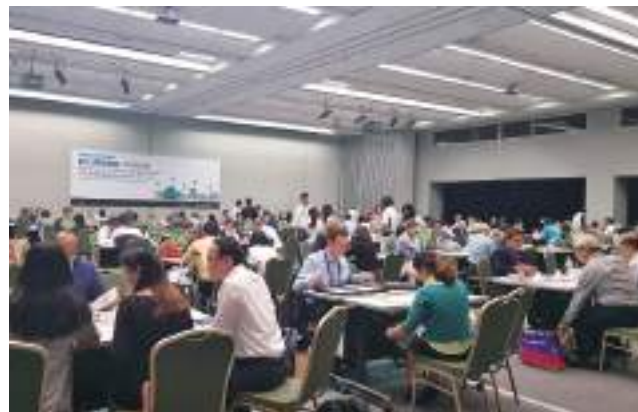
2019 年全球零售通路採購大會。