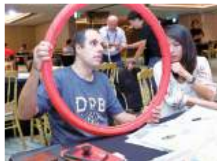
貿協辦理「2019年中部產業聚落採購大會——自行車」，邀請國際買主到台中聚落與業者洽談及參訪。

臺灣自行車產業擁有完善的上、中、下游供應鏈，透過積極的研發創新以及自有品牌的建立，在國際市場素有「自行車王國」的美譽。近年來，隨著電動自行車風潮迅速在全球市場崛起，我自行車業者具備高度彈性的研發能力，又能借助臺灣 ICT 產業的強項，形成優勢，面對如此龐大的市場機會，貿協提供多元拓銷平台，協助您進軍國際市場！