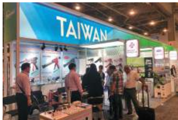
貿協與手工具公會合作籌組「2019 年全美五金展參展團」。

臺灣素有「手工具王國」美名，未來臺灣手工具產業可朝向智慧製造、複合功能及綠色環保等高附加價值產品方向發展。歡迎使用貿協多元拓銷平台，協助您進軍國際市場！