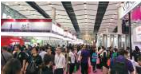
2019 中國進出口 商品交易會。

中國大陸為我國重要出口市場，亦是貿協拓銷之重點市場之一。歡迎有志前往中國大陸拓銷的廠商參加由本會籌組的中國第一展「中國進出口商品交易會」（簡稱廣交會）、各項大型綜合性博覽會（如福州海峽兩岸經貿交易會及中國國際進口博覽會等）參展團及本會駐中國大陸同仁帶回的第一手市場資訊的「中國大陸商機日」等活動。