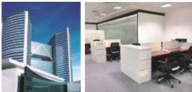
杜拜育成中心 JAFZA ONE 外觀。 育成中心會議室及產品發表室。

杜拜是中東市場最大的轉口市場，其市場影響力涵括整個中東地區，往西達到非洲，往東擴及南亞。貿協在杜拜杰貝阿里 Jafza 自由貿易區成立育成中心，以最優惠的條件協助欲拓銷中東市場的廠商設立海外據點。一次解決您在杜拜當地申請營業執照、設立公司、居留簽證、工作證以及開設公司與個人帳戶等一系列問題。不必猶豫，敬請把握良機，加入我們的行列。