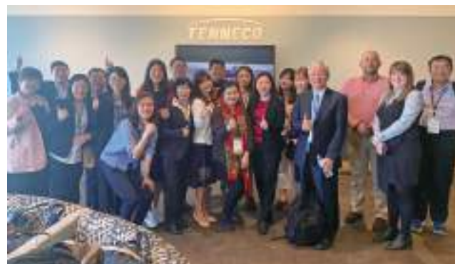
2019 年扣件美墨團率領團員拜訪全球百大汽車 OEM 商的美商 TENNECO。

扣件產業為臺灣重要的傳產之一，透過業者不斷轉型升級，讓台灣扣件在國際上極具競爭力。為擺脫與其他亞州國家的低價競爭，積極朝向高附加價值產品發展為我國扣件產業刻不容緩的發展策略。為協助業者拓展海外市場，貿協規劃多項拓銷活動，歡迎各位加入。