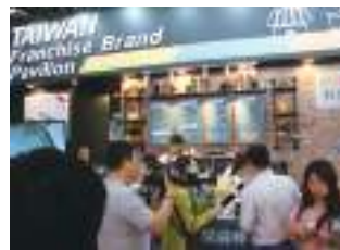
海外拓銷活動——台灣連鎖品牌。

連鎖加盟品牌計劃到海外展店，卻有不知從何著手，一籌莫展之感。多年來，貿協帶領連鎖業者參加海外展覽，開發國際代理商機，透過展覽及拓銷團提升品牌國際知名度，進一步協助品牌授權。跟著貿協三階段到海外布局，一起循序漸進、穩紮穩打，加速達成展店的效益及目的。未來，貿協也將進一步協助業者透過數位工具，設置線上展覽及產業專區，並辦理線上買主視訊媒合洽談會，協助業者持續開發全球布局商機。