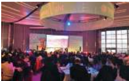
2019年於漢諾威工具機展設置臺灣智慧形象館、辦理臺灣之夜、VR記者會等。

近年全球主要國家均積極尋求機械產業升級轉型，德國、美國或中國大陸皆開始鼓勵產業朝向設備智慧化、工廠智慧化等方向發展；我國政府亦於2016年擬定「5+2 產業創新政策」，為配合推動重點發展智慧機械產業，國際貿易局規劃自2018年起執行「智慧機械海外推廣計畫」，透過於全球目標市場重要展覽辦理整合行銷活動，搭配多元創新手法行銷，期提升我國智慧機械產業國際形象及協助業者爭取海外商機。