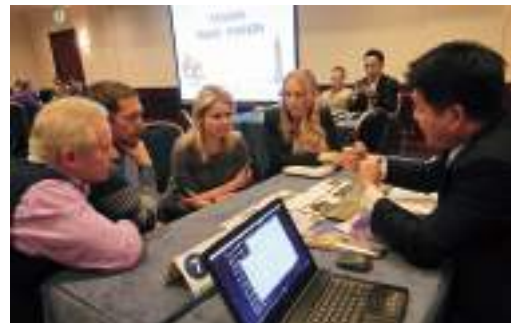
拓銷團於當地辦理貿易洽談會洽談情形。

為協助我國企業進軍全球市場，貿協每年均辦理拓銷團，結合本會駐外單位的專業協助，安排廠商與當地買主進行面對面貿易洽談爭取商機，並辦理市場報告研討會及市場考察行程，協助廠商認識市場並取得最新商情資訊。疫情期間，貿協也把貿訪團改為「線上模式」。「線上貿訪團」藉由數位推廣宣傳集結當地買主上線，讓報名業者在虛擬會議廳進行一對一洽談。