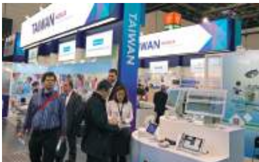
杜塞道夫醫療器材展，買主聆聽我商產品解說。

近年醫材產業跨領域應用日新月異，創新醫療技術研發及醫材結合 ICT 產業優勢，更進一步發展智慧醫療等相關新領域應用，成為臺灣醫材產業轉型的重要契機。貿協將聚焦於創新高階醫材及醫療應用趨勢，協助業者拓展全球醫材市場！另因應疫情，加強我防疫產品業者透過數位方式行銷海外市場，協助全球對抗疫情。