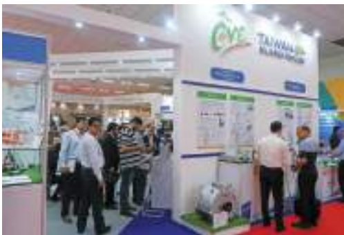
臺灣電動車行銷聯盟，前往新德里參加台灣形象展。

電動車商機是近來最火熱的議題之一，然而廠商不知從何獲得最新商情與商機，也不知如何將自身具競爭優勢的產品與技術外銷海外市場。因此，貿協於 2018 年 2 月成立電動車行銷聯盟，集結我國電動車產業上中下游重要廠商，發揮團體力量，以國家隊方式拓銷海外，建立「電動車王國」之形象。此外，本聯盟定期提供最新產業資訊及客製化服務，歡迎有興趣的電動車業者加入此平台共同打拚。