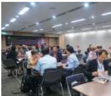
2019 年台北國際電腦展 EEN 媒合會，邀請荷蘭商予我商洽談，促成雙邊技術及商務合作。

想進軍歐洲市場嗎？有好產品卻沒有銷售管道嗎？讓貿協「歐洲經貿網臺灣商務中心」平台來協助您！歐盟官方成立的歐洲經貿網（Enterprise Europe Network，簡稱 EEN），提供龐大的商機網絡與豐富的資料庫內容，是企業與研究機構尋求歐洲貿易、研發及技轉夥伴的最佳途徑！