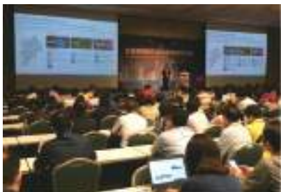
Bosch 分享未來自駕車規劃藍圖。

電子資通訊產業是帶動我國經貿出口成長的火車頭，尤其臺灣在半導體、顯示器和通訊等多項產品位居全球領先地位，未來在 5G 通訊、自駕車、邊緣運算、智慧與聯網應用也將占據重要的角色。貿協產業拓展處將協助我商拓展電子資通訊創新應用市場，促成跨領域商業合作，持續增強產業的全球優勢。