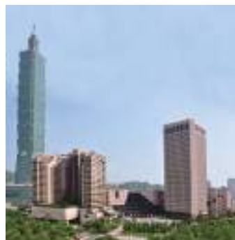
台北世界貿易中心包含功能完整的五合一建築群。（由左至右為：台北 101 大樓、君悅酒店、世貿一館、國貿大樓及台北國際會議中心。）