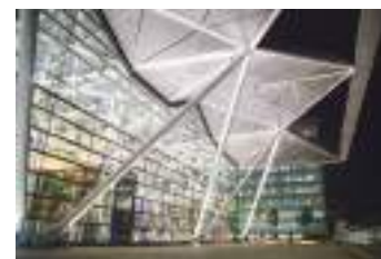
台北南港展覽館 2 館 7 樓星光會議中心。108 年 11 月啟用，挑高室內空間，寬敞室內長廊及戶外花園，滿足現代會展活動的多元需求。

📍 台北世界貿易中心（世貿一館） https://www.twtc.com.tw