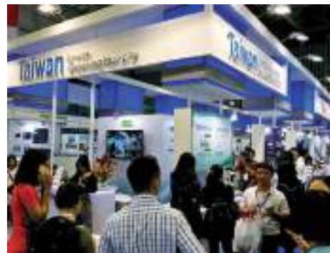
「2019 越南國際水工程大展」臺灣綠色產品形象館人潮絡繹不絕。

各國政府為達成巴黎協定之目標，並落實「國家自定貢獻」減碳的承諾，正積極推動因應氣候變遷的政策法規及節能減碳措施，臺灣也不例外，未來預期將帶動綠色能源、節能及能源管理、智慧建築、電動車等產品、技術與系統服務的需求。在綠色商機下，讓貿協協助您掌握國際綠色產業資訊，爭取更多貿易機會，協同開發海外綠色市場！