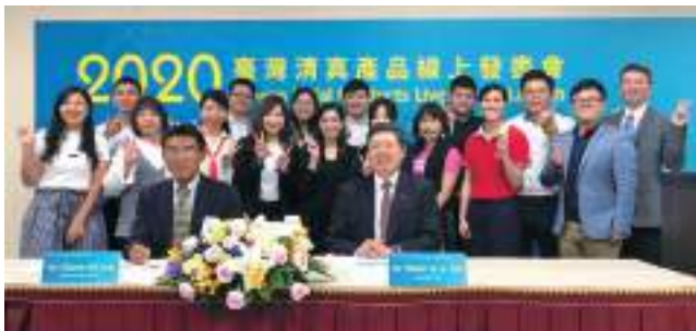
2020 臺灣清真產品線上發表會。

穆斯林商機正夯，想打入擁有占全球人口 24.1%、18 億龐大穆斯林市場，就不可不知「清真驗證」。全球清真產業市場預估在 2030 年將可達 5 兆美元規模。臺灣清真推廣中心於 2017 年 4 月 21 日成立，持續提供各國最新清真商情、輔導廠商申請清真驗證、舉辦各類線上或實體活動包括海外拓銷展團、洽邀買主來臺採購及舉辦臺灣清真食品節等活動，積極提升臺灣清真產業國際知名度，歡迎有興趣的業者加入，共同開拓商機。