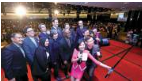
2019 年 1 月新南向國家企業家聯誼會——新春茶會暨指南星俱樂部開站。

新南向 18 國的市場潛力不容忽視，想要獲得最新商機資訊嗎？想要參與最新、最優質的市場調查研討會嗎？新南向國家企業家聯誼會為有意願前往新南向國家發展的臺灣廠商量身打造，以企業家間資訊分享、經驗交流、群聚能量為三大目標持續提供服務，以電子報的形式，把握市場脈動、拓銷活動、貿易資源等。另外，指南星俱樂部互動平台，以虛擬社群連結會員，並結合交流會、市場報告會等實體活動，協助會員拓展新南向市場商機，加強廠商間的互動。歡迎免費加入會員，即時掌握最新商情與商機！