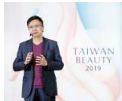
2019 年 TAIWAN BEAUTY 國際記者會。

臺灣美粧產業累積多年為國際知名美粧品牌代工經驗，不論在技術與品質上深受國際大廠肯定。近年臺灣美粧產業蓬勃發展，自創品牌，帶動臺灣美粧產業發展與創新。貿協也積極協助臺灣美粧品牌業者拓展國際市場，歡迎參加貿協美粧行銷活動，以團體戰方式進軍國際舞台！