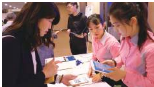
採購洽談會場利用數位報到完成進場。

貿協舉辦各式洽談會，如視訊採購洽談、買主來臺採購洽談、採購商機說明會、展覽洽談會及商機日等，均透過採洽易網站為臺灣廠商提供完整的一站式服務。歡迎下載 ONE TAITRA App，取得 QR Code 完成數位報到進場、查詢場地位置、瀏覽買主資料、進行現場報名與候補，用科技化的方式完成洽談，輕鬆成交。