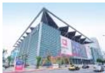
台北南港展覽館 2 館