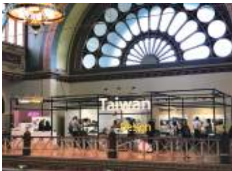
Taiwan In Design 澳洲設計週——展館整體設計傑出吸睛。