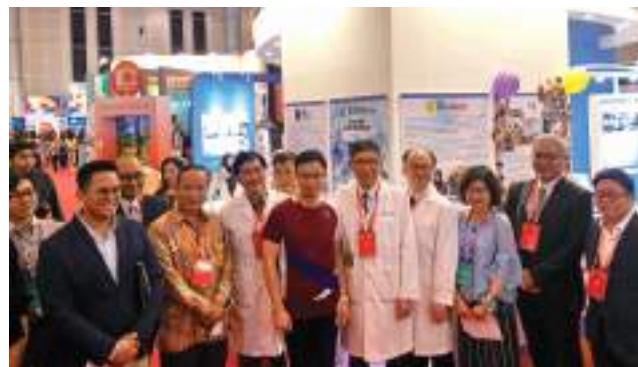
臺灣形象展——健康產業形象館以軟帶硬展現臺灣醫療實力。

臺灣健康產業的軟、硬體產品質量兼備，已躍上國際舞台，本會以搭配各種海外展團辦理健康產業形象館、研討會、記者會及媒體專訪等，吸引國際買主前來尋求合作。在疫情影響下推出數位行銷，媒合國內醫院與新南向市場、中國大陸及中南美洲等國家醫療相關業者辦理線上防疫研討會，推廣臺灣的防疫產品與服務，展現台灣醫療實力。