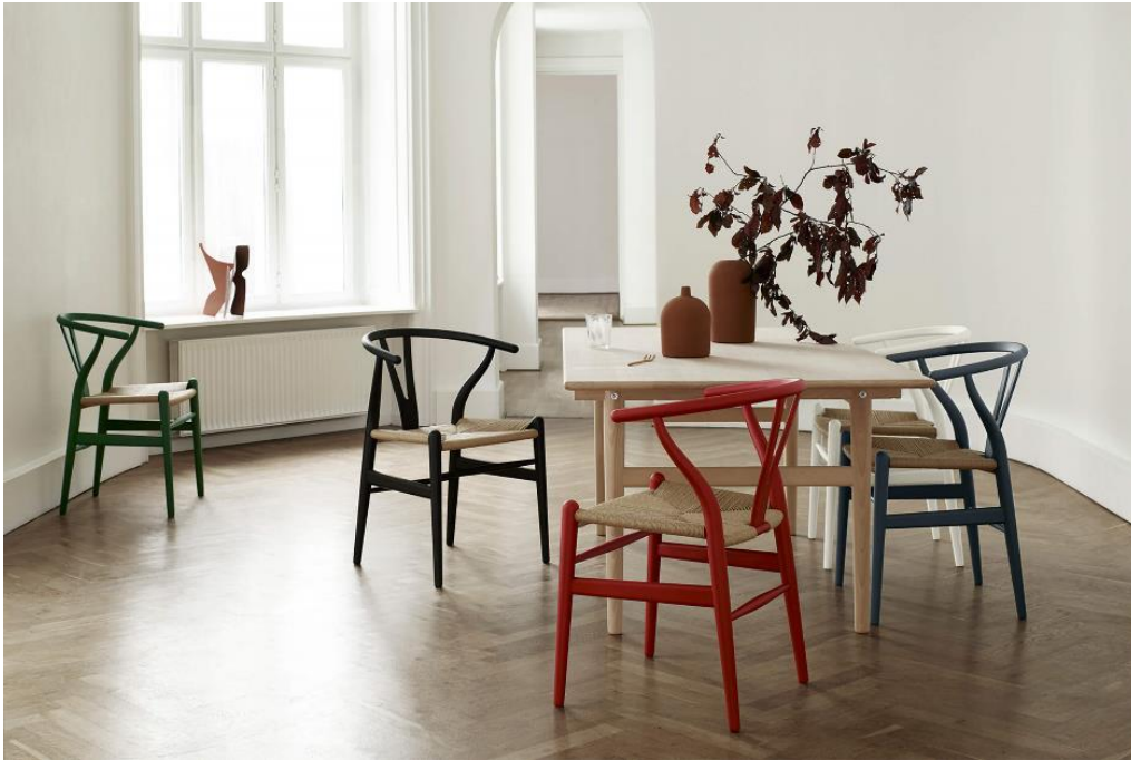
Carl Hansen & Sons osallistuu Design Helsinki -tapahtumaan ja esittelee upean showroominsa.