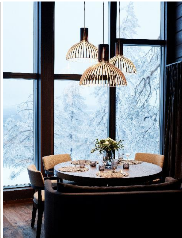
Herman Miller ja Secto Design ovat Design Helsinki -tapahtuman brändejä.

Tapahtuman keskeisenä paikkana on Kasarmintorille rakennettava kansainvälinen design-paviljonki. Upeiden historiallisten rakennusten ympäröimä Kasarmintori on valittu tapahtumapaikaksi sen arkkitehtonisen merkityksensä vuoksi. 1650 neliömetrin kokoisesta paviljongista vierailijat löytävät johtavien skandinaavisten ja kansainvälisten sisustusalan huonekaluja, valaisimia, pintoja, arkkitehtonisia viimeistelyjä ja paljon muuta.