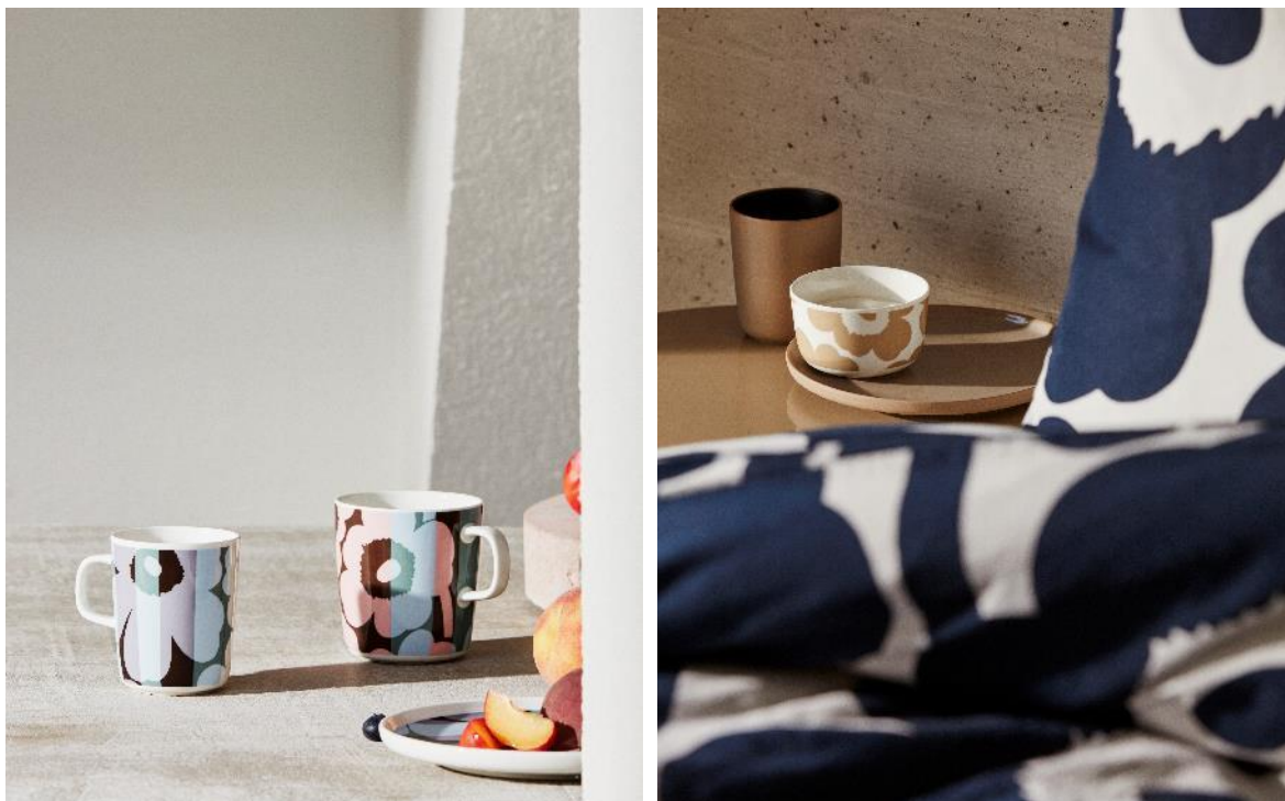
Marimekon suosio Suomessa ja ulkomailla kasvaa koko ajan.

Festivaaliin osallistuvat lukuisat showroomit tarjoavat inspiroivaa ohjelmaa kuten keskusteluja, työpajoja, tuotelanseerauksia ja paljon muuta. Kävijä voi tutustua ikonisten ja klassisten kansainvälisten huippubrändien näyttelytiloihin kuten Carl Hansen, Norman Copenhagen ja Kvadrat, joita täydentävät suomalaiset Marimekko, Skanno, Aarikka ja monet muut. Showroomeissa esitellään toinen toistaan upeampia huonekaluja, valaisimia, teknisiä ratkaisuja ja huippulaadukkaita materiaaleja.