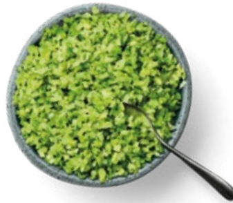
Riced Broccoli Arroz de Brócoli