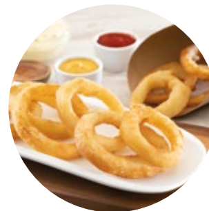
Beer Battered Natural Onion Rings Aros de Cebolla Naturales a la Cerveza