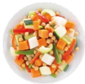
Couscous Mix Verduras para Couscous