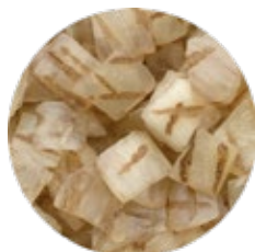
Chopped Grilled Onion Cebolla Picada al Grill