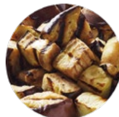
Chopped Grilled Aubergine Berenjena Troceada al Grill