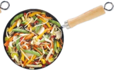
Asian Style Wok Mix Mezcla Wok estilo Asiático