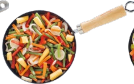
Thai Stir-Fry Salteado Tailandés