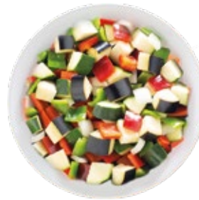
Ratatouille Mezcla para Pisto - Ratatouille