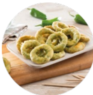
Battered Green Pepper Rings Aros de Pimiento Verde Rebozados