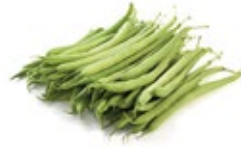
Green Beans / Judías Verdes