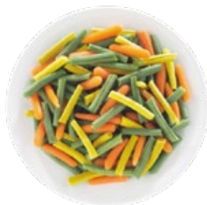
Beans and Carrot Mix Mezcla de Judias con Zanahoria