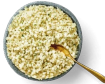
Riced Cauliflower with Herbs and Garlic Arroz de Coliflor con Especias y Ajo