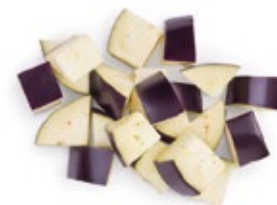
Chopped Aubergine Berenjena Troceada

Consult formats, other cut shapes and vegetables / Consultar formatos, otros cortes y vegetales