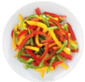
Tricolour Peppers Strips Pimiento Tricolor en Tiras