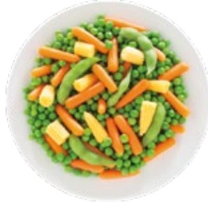
Baby Vegetables Mix Mezcla de Verduras Baby