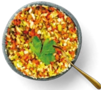
Riced Cauliflower, Broccoli and Carrot Arroz de Brócoli, Coliflor y Zanahoria