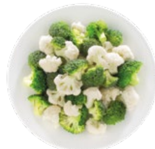
Two Floret Mix Mezcla de Brócoli y Coliflor