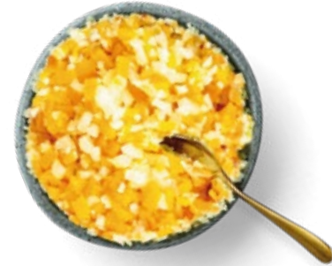
Riced Cauliflower and Butternut Squash Arroz de Coliflor y Calabaza