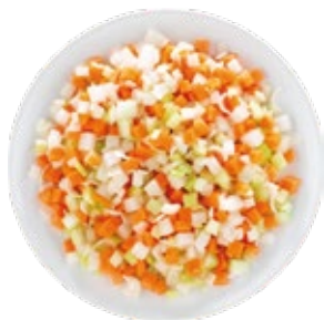
Brunoise Vegetable Mix Verduras corte Brunoise