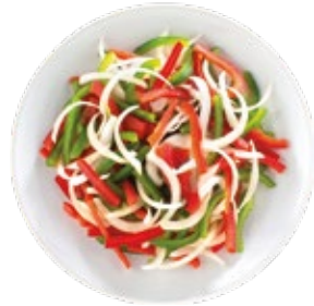
Peppers and Onion Strips Pimiento y Cebolla en Tiras