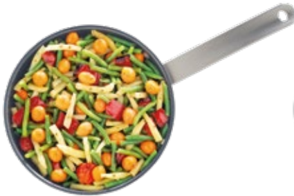
Parisian Stir-Fry Salteado Parisino