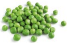
Peas / Guisante