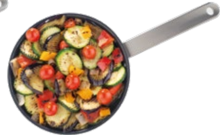
Mediterranean Grill Stir-Fry Salteado Mediterráneo al Grill