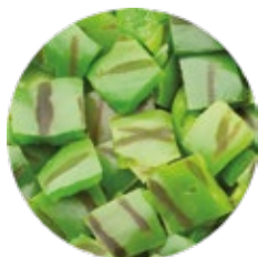
Chopped Grilled Pepper Pimiento Troceado al Grill