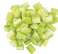
Chopped Celery Apio Troceado