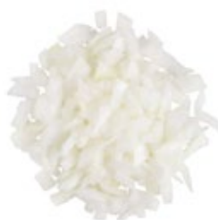
Chopped Onion Cebolla Picada