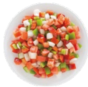
Sofrito Mix Mezcla para Sofrito