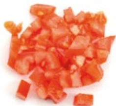
Chopped Tomato Tomate Troceado