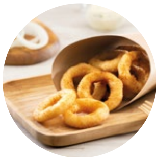
Breaded Onion Rings Aros de Cebolla Empanados