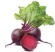
Beet / Remolacha

Naranja o amarilla. Troceada en cubos, bastones rodajas y baby