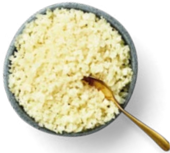
Riced Cauliflower Arroz de Coliflor