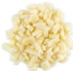
Chopped Garlic Ajo Picado