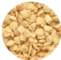
Chopped Par-fried Onion Cebolla Troceada Prefrita