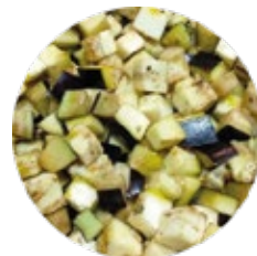
Chopped Par-fried Aubergine Berenjena Troceada Prefrita

Consult formats, other cut shapes and vegetables / Consultar formatos, otros cortes y vegetales