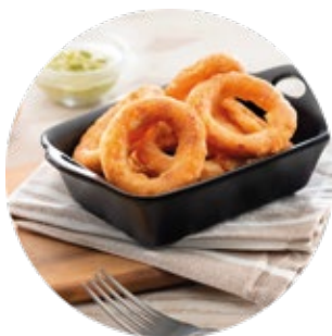
Battered Red Pepper Rings Aros de Pimiento Rojo Rebozados