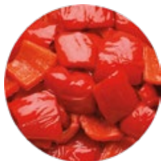
Chopped Par-fried Pepper Pimiento Troceado Prefrito