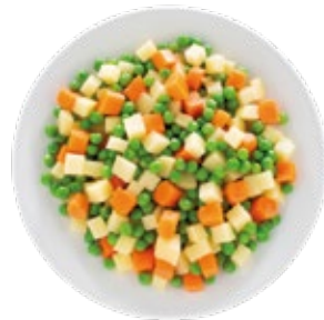
Russian Salad Mix Mezcla para Ensaladilla Rusa