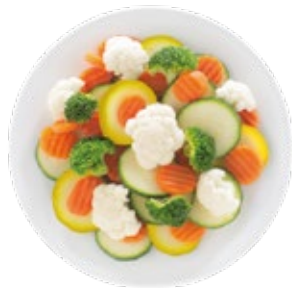
Normandy Blend Mezcla Normandia