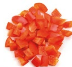
Chopped Red Pepper Pimiento Rojo Troceado