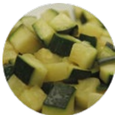
Chopped Par-fried Courgette Calabacín Troceado Prefrito