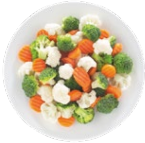
Kaiser Mix Mezcla Kaiser