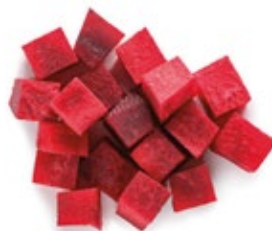
Chopped Beet Remolacha Troceada