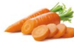
Carrot / Zanahoria

Verdes o amarillas. Cortadas o enteras Diferentes tamaños