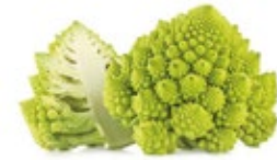
Romanesco / Romanesco