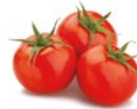
Tomato / Tomate