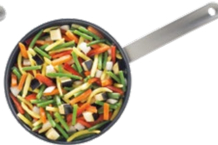
Campestral Stir-Fry Salteado Campestre