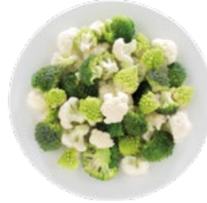
Three Floret Mix Brócoli, Coliflor y Romanesco