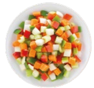
Italian Sofrito Mix Mezcla para Sofrito Italiano