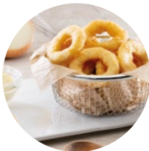
Battered Onion Rings Aros de Cebolla Rebozados