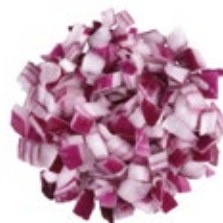
Chopped Red Onion Cebolla Roja Picada