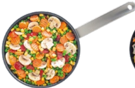
French Stir-Fry Salteado Francés