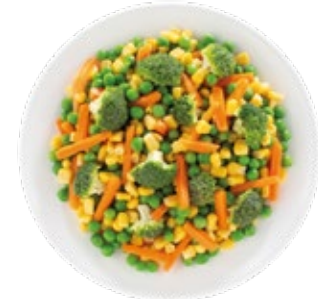
Asian Blend Mezcla Asiática