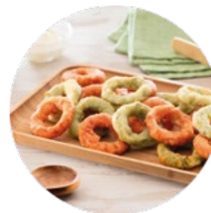
Hot Pepper Rings with Jalapeño Aros de Pimiento Picantes con Jalapeño

No artificial colours, flavours or hydrogenated fat / No contiene colorantes, ni saborizantes artificiales, ni grasas hidrogenadas.