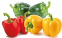
Pepper / Pimiento