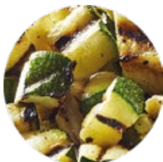
Chopped Grilled Courgette Calabacín Troceado al Grill